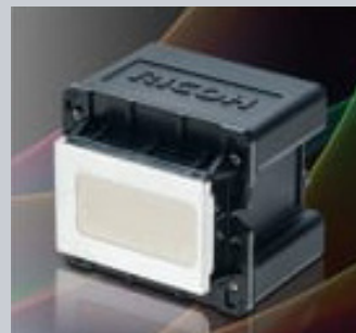
RICOH G5i (TH5241)