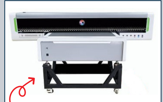
SOPORTE MÓVIL OPCIONAL