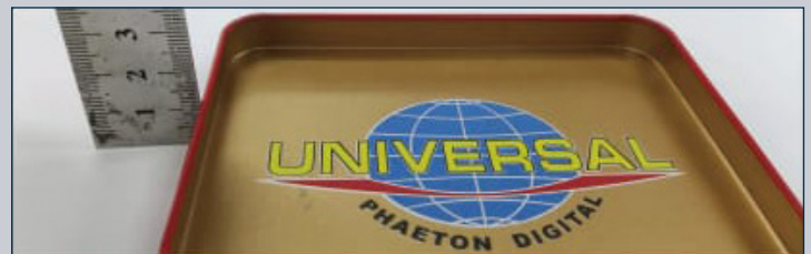
ALTO DE IMPRESIÓN DE 15mm.