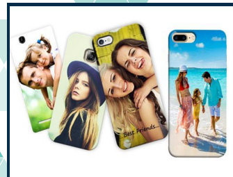
FORROS DE CELULAR